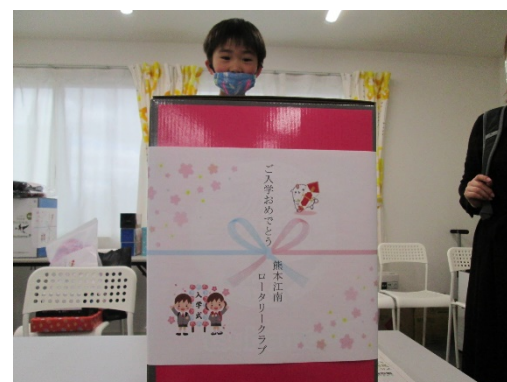
ご入学おめでとう！！