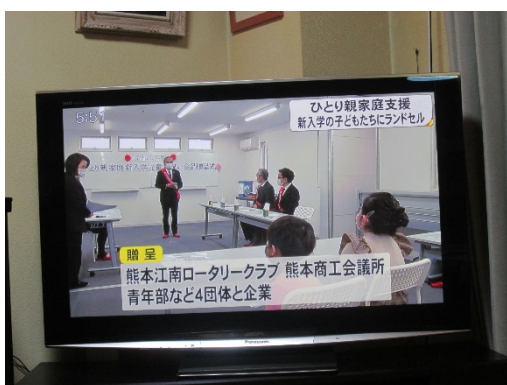
テレビ熊本 TKU ニュース (1)