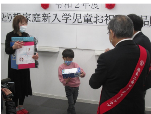
ランドセル・学用品の贈呈の様子