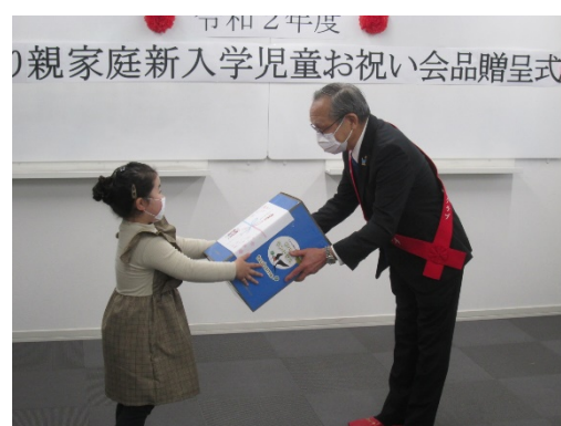
ランドセル贈呈の様子